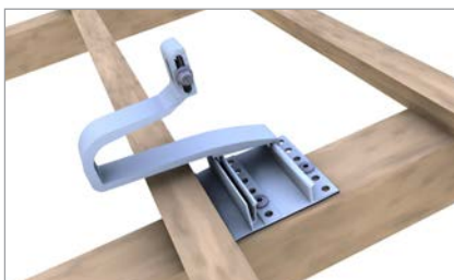
Position Grundprofil am Sparren