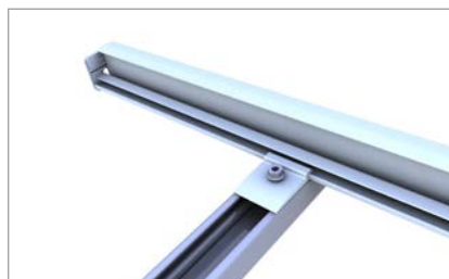
Einlegeschiene auf C-N-Schiene